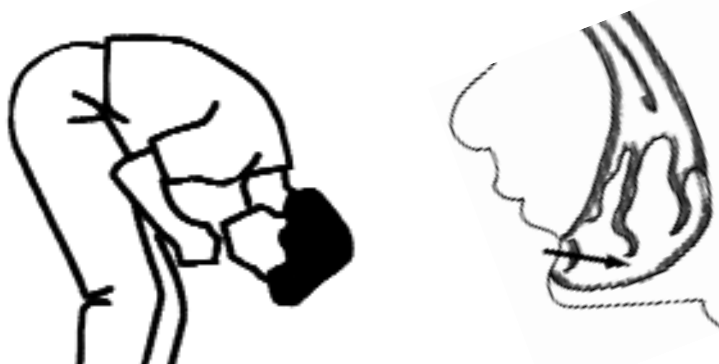
Ryc. B. Siedząc lub stojąc, należy pochylić się głęboko do przodu, tak żeby głowa znalazła się na wysokości kolan