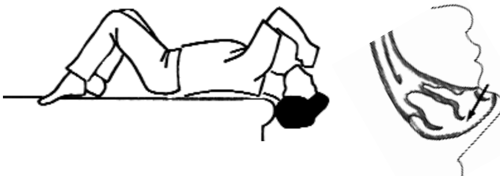
Ryc. C. Położyć się na łóżku z głową umieszczoną poza krawędzią łóżka, a następnie odchylić ją maksymalnie do tyłu