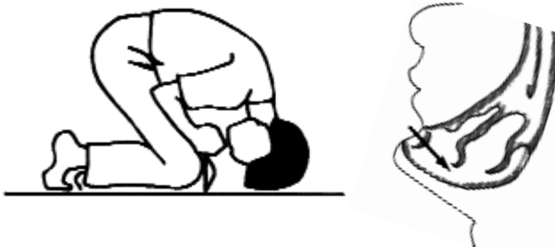
Ryc. A. Należy uklęknąć na podłodze, pochylić się głęboko do przodu i oprzeć głowę na podłodze