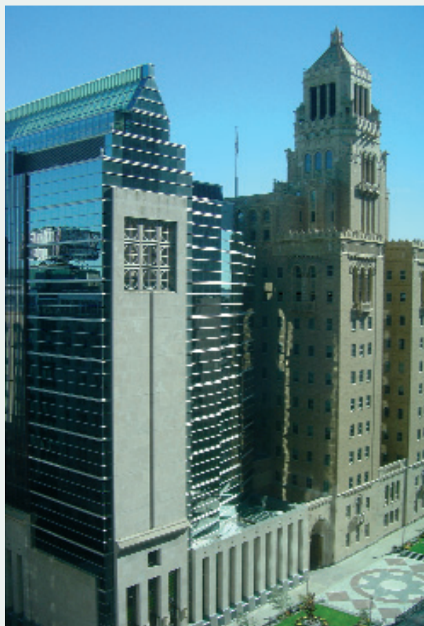
Mayo Clinic w Rochester

Osiągnięcia naukowe w zakresie medycyny sięgają roku 1914, kiedy to jeden z braci Mayo wyizolował tyroksynę. Następnie w roku 1920 opracował system stopniowania nowotworów (ang. grading ) na bazie numerycznej, stosowany do dnia dzisiejszego. W roku 1934 w Mayo Clinic dr Kendall wyizolował kortyzon, hormon kory